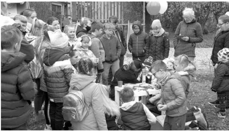
Vaikai nekantraudami laukė, kad veidukai būtų išpiešti.