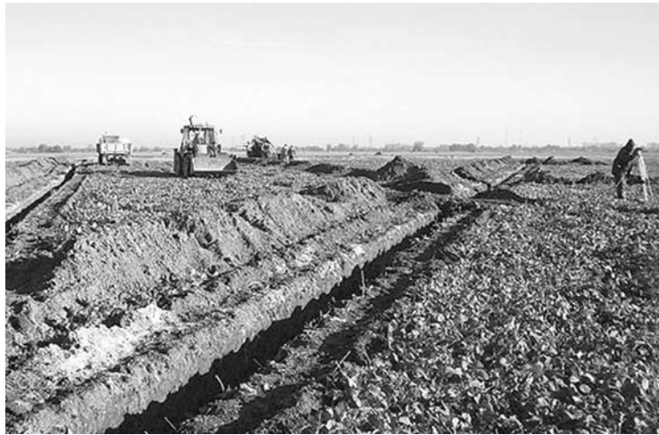
Drenažo ir kitų melioracijos statinių nusidėvėjimas siekia daugiau nei 70 proc., tad investicijos į melioracijos sistemą yra būtinos.

„Žemių savininkai neturi atsakyti už turtą, kurio valstybė